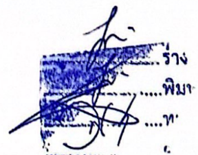
(นางเกื้อจิตต์ จูริมาศ) นายกเทศมนตรีตำบลสีแก้ว

ประกาศ ณ วันที่ ๑๔ เดือน กุมภาพันธ์ พ.ศ. ๒๕๖๗